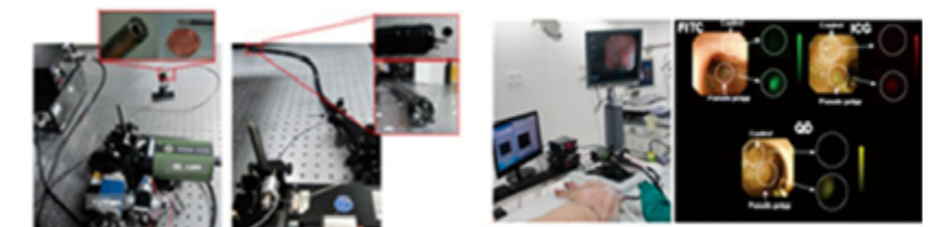
채널삽입형 다중형광 내시경 시스템

발 표: 논문 (2)_Biomedical Optics Express (IF:3.34, 2014 and 2017) 국제학회 발표(2), 국내학회(6)